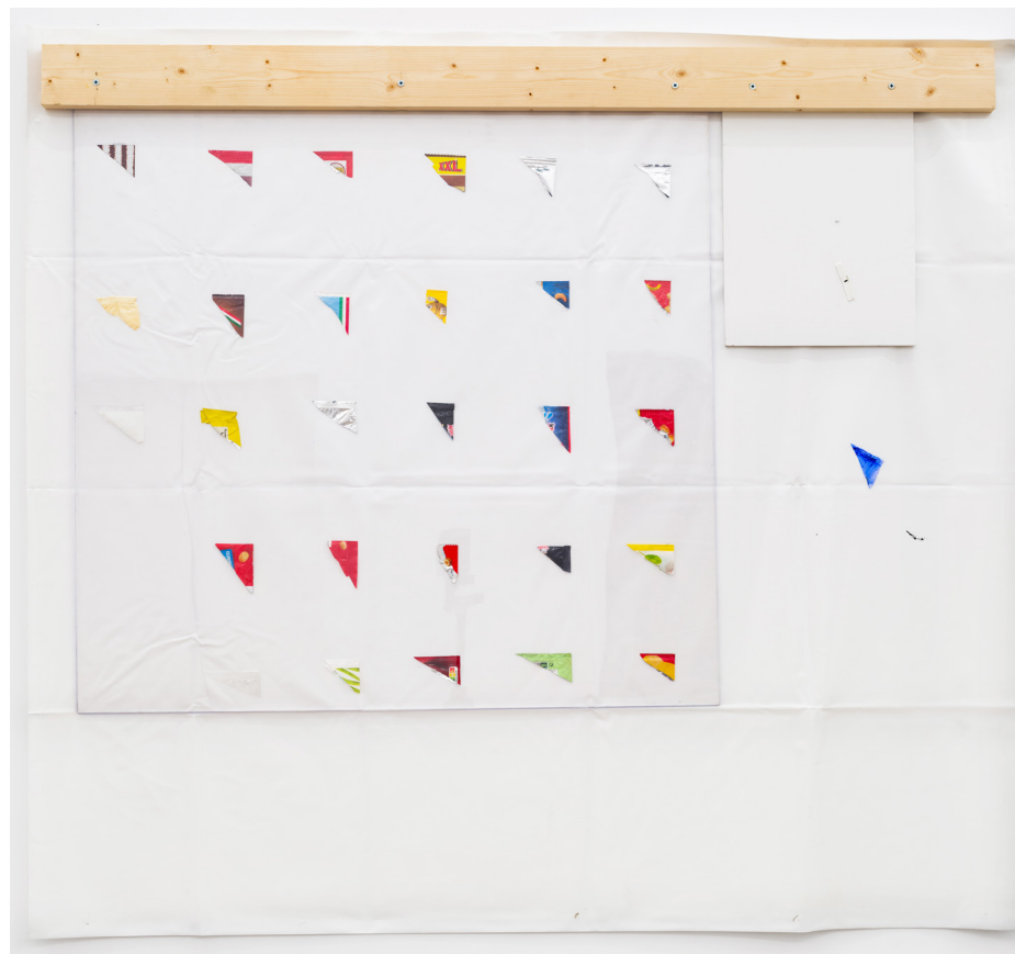
"Untitled" 2023