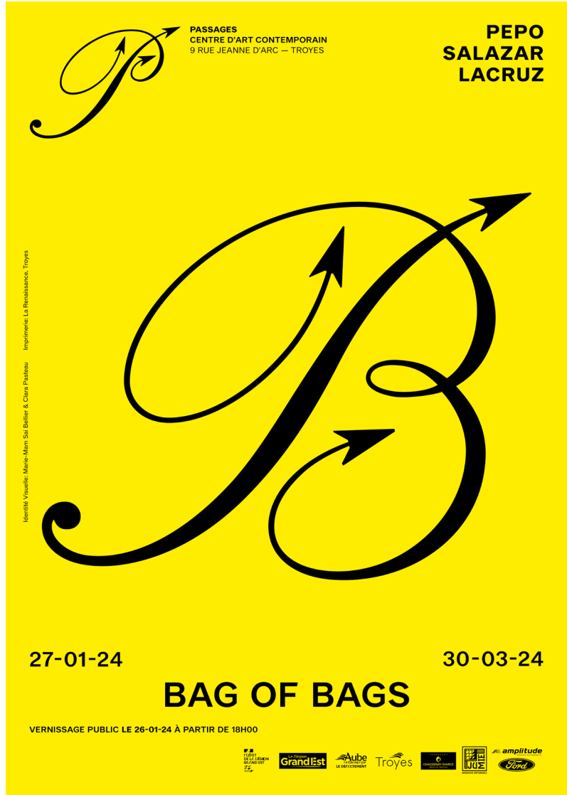
Affiche de l'exposition