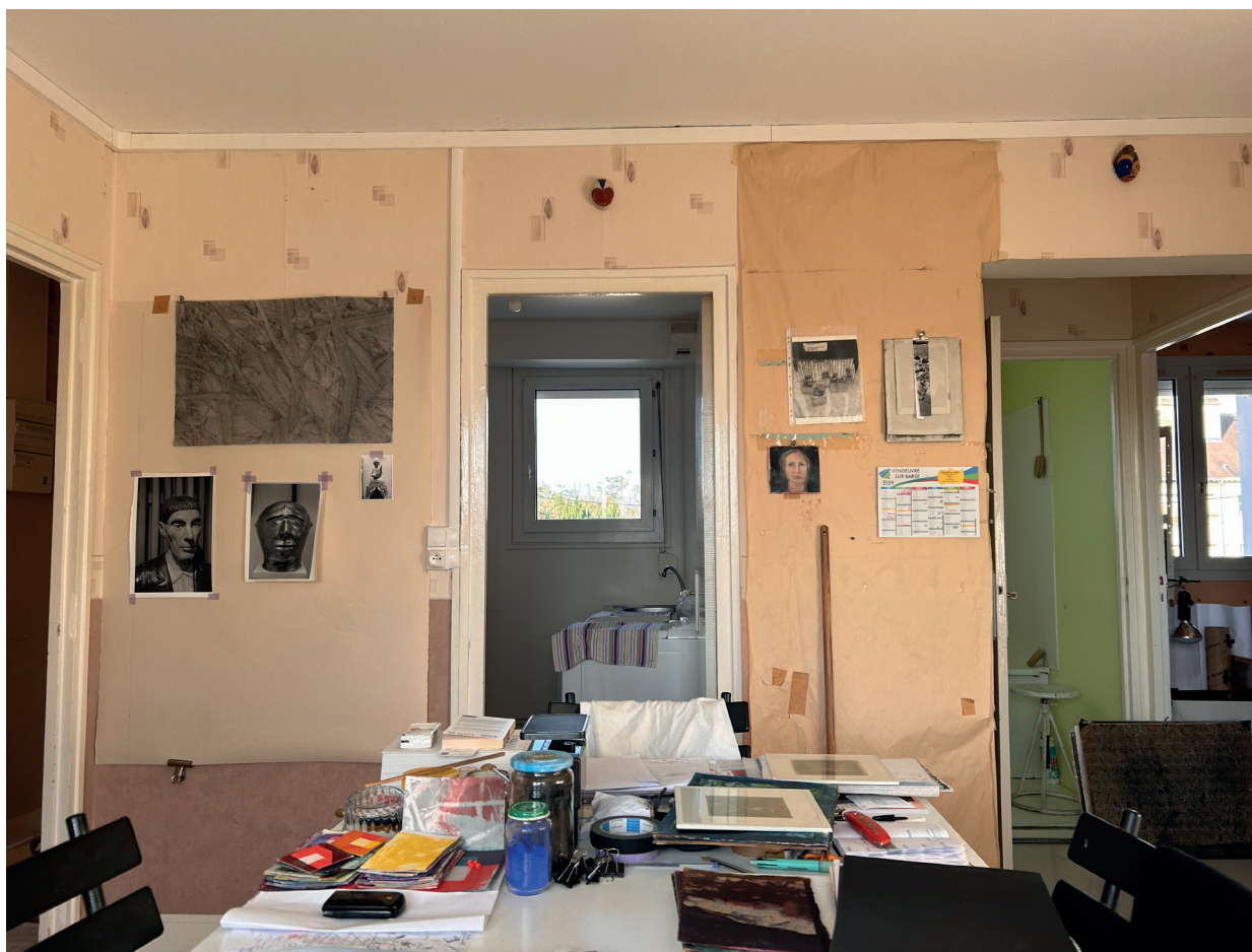
Atelier de Nadine Monnin