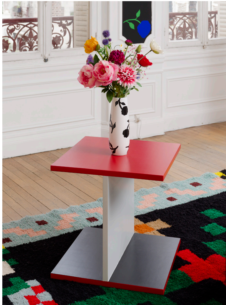
Vue d'exposition, Casa Karina , Karina Bisch, du 17 janvier au 18 avril 2026 Crédits photos: Aurélien Mole Courtesy de l'artiste Karina Bisch et ADAGP 2026