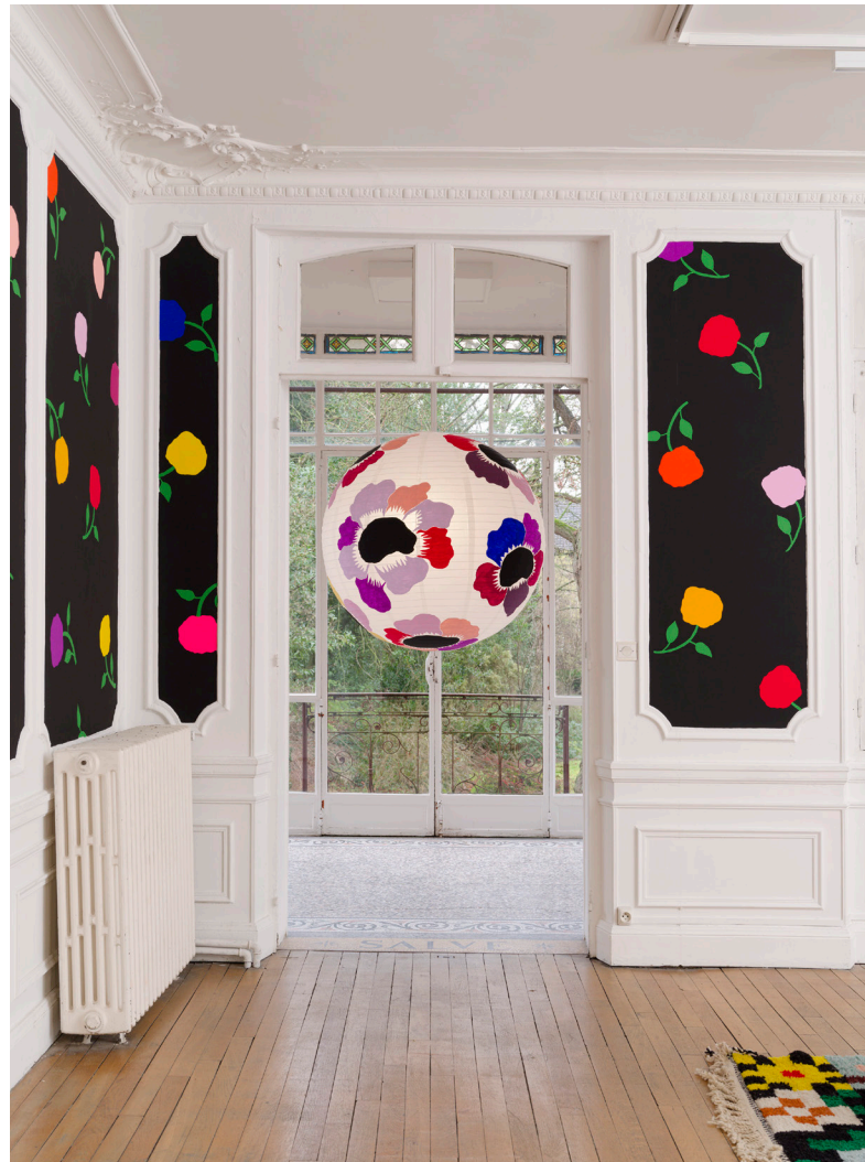
Vue d'exposition, Casa Karina , Karina Bisch, du 17 janvier au 18 avril 2026 Crédits photos: Aurélien Mole Courtesy de l'artiste Karina Bisch et ADAGP 2026