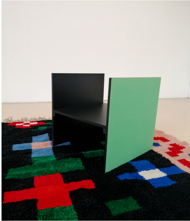
Module Sonia (coll. Painting For Living ), 2025