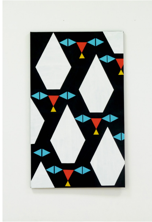
Cat's Eyes , 2011