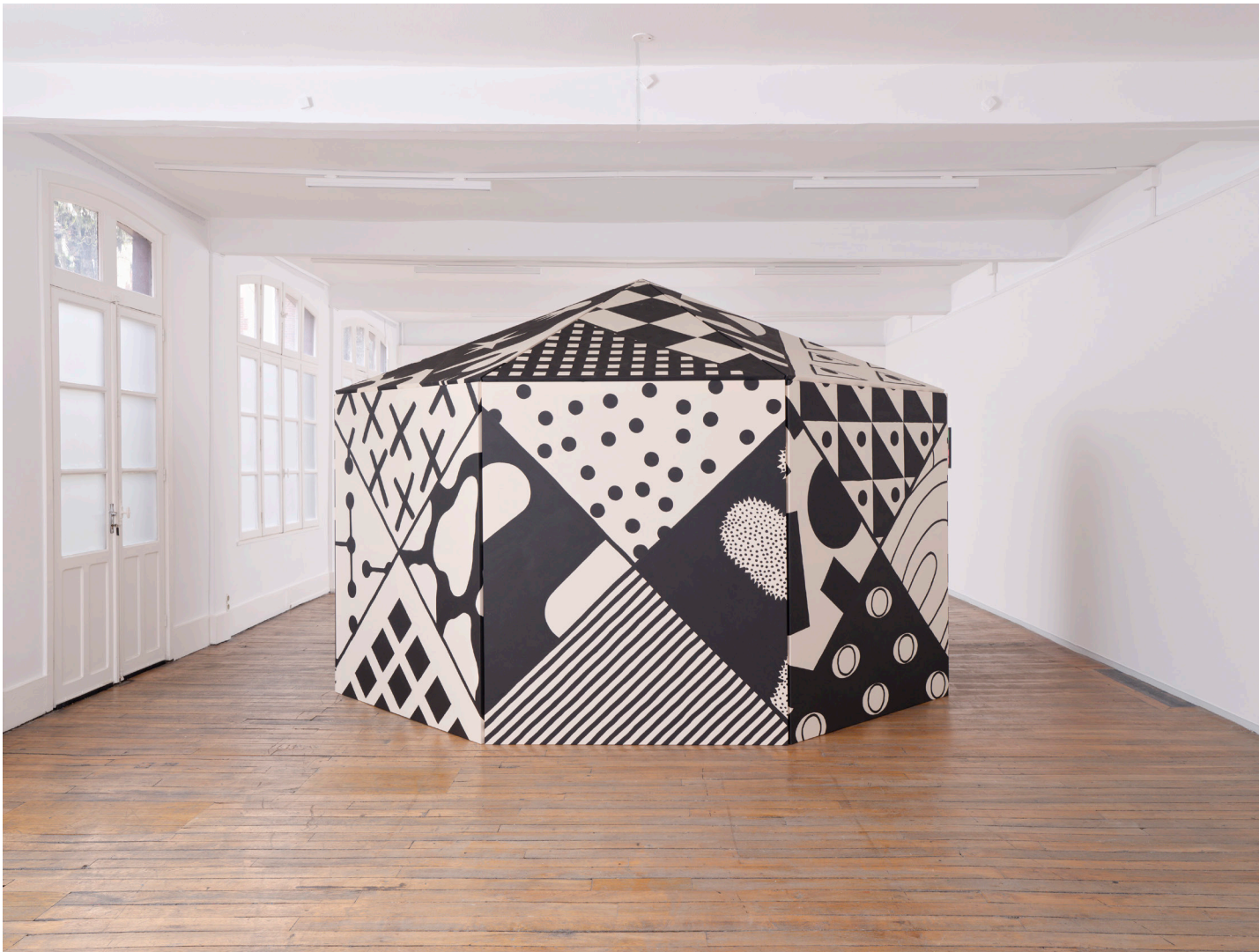
Vue d'exposition, Casa Karina , Karina Bisch, du 17 janvier au 18 avril 2026 Crédits photos: Aurélien Mole Courtesy de l'artiste Karina Bisch et ADAGP 2026