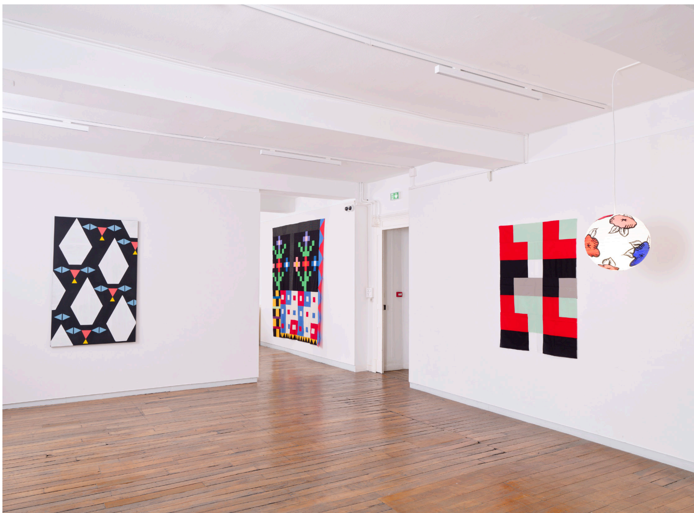
Vue d'exposition, Casa Karina , Karina Bisch, du 17 janvier au 18 avril 2026 Crédits photos: Aurélien Mole Courtesy de l'artiste Karina Bisch et ADAGP 2026