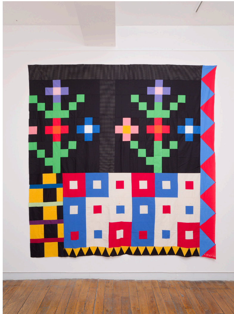
Vue d'exposition, Casa Karina , Karina Bisch, du 17 janvier au 18 avril 2026 Crédits photos: Aurélien Mole Courtesy de l'artiste Karina Bisch et ADAGP 2026