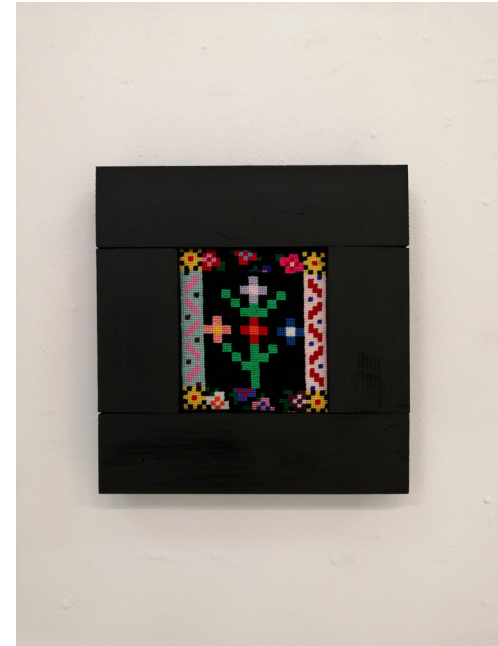
Tableau Pointilliste - Replica , 2024 Laine, aïda, bois et peinture 27,8 × 26,5 cm Courtesy de l'artiste et ADAGP 2025.