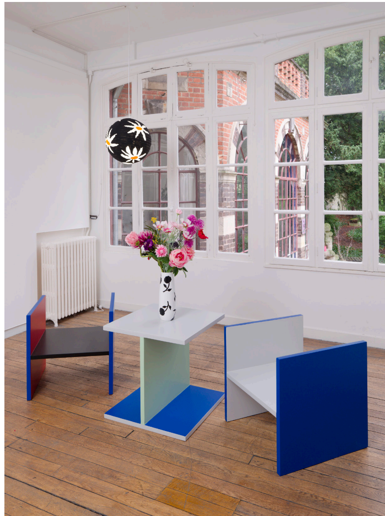
Vue d'exposition, Casa Karina , Karina Bisch, du 17 janvier au 18 avril 2026 Crédits photos: Aurélien Mole Courtesy de l'artiste Karina Bisch et ADAGP 2026