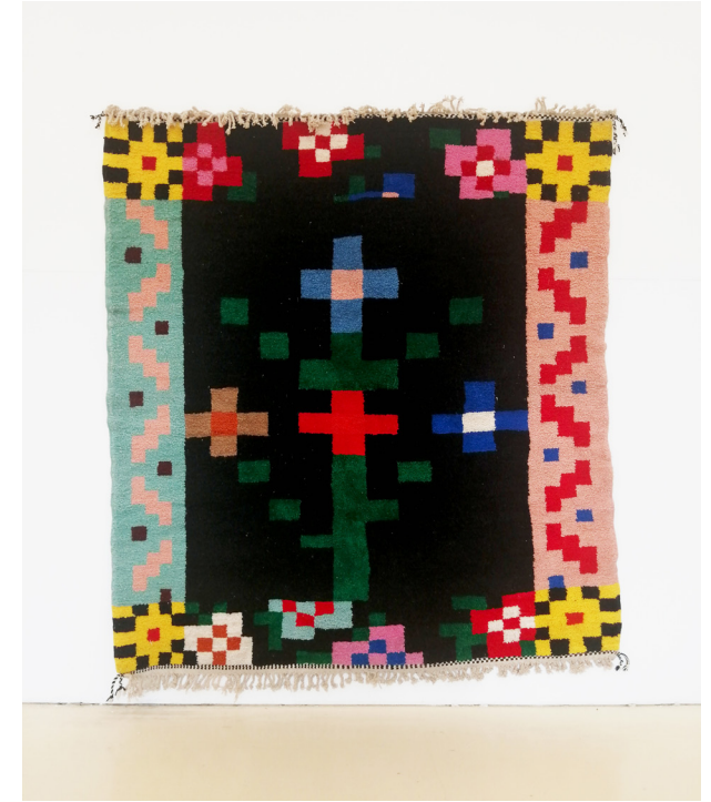
Tapis (coll. Painting for living ), 2025