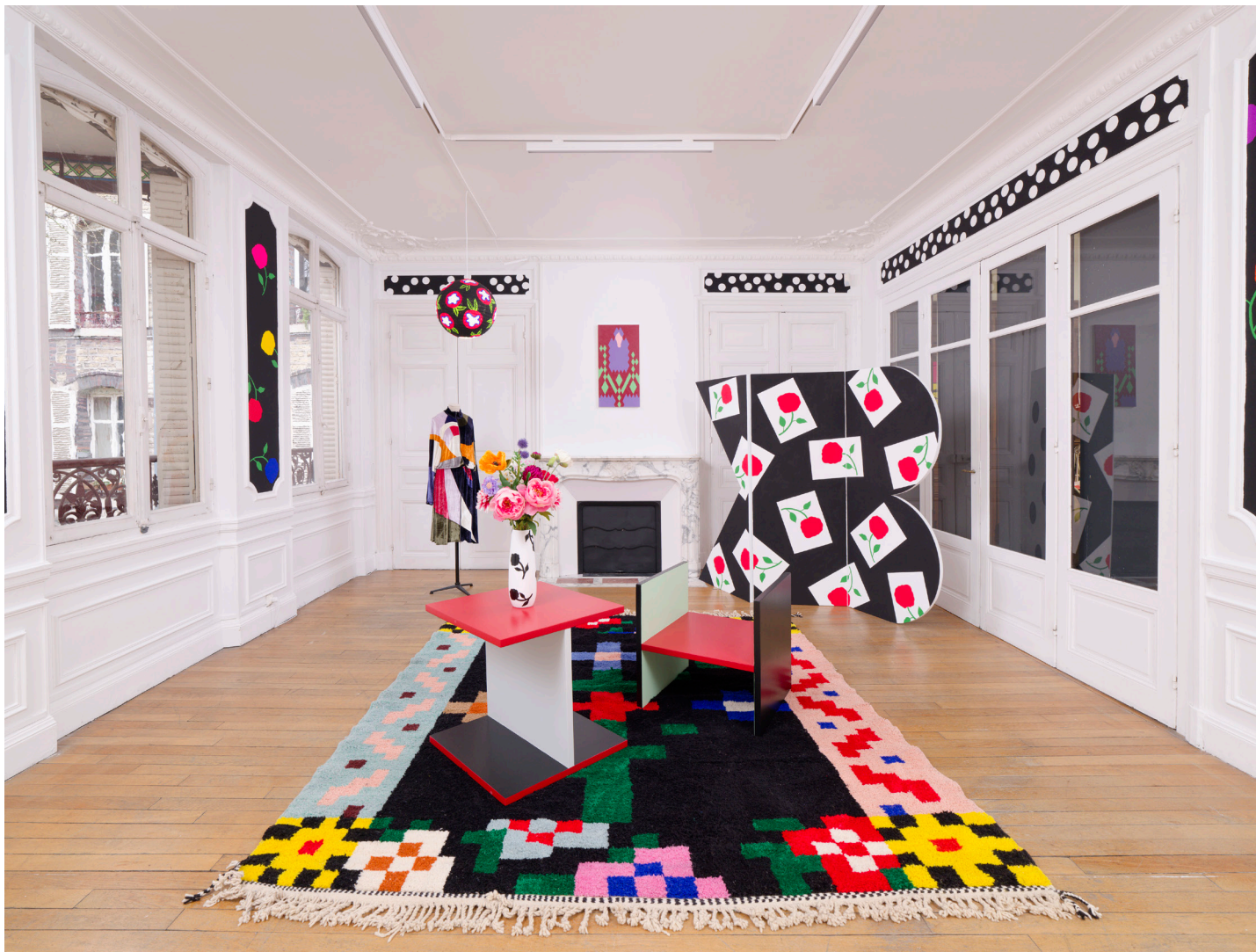
Vue d'exposition, Casa Karina, Karina Bisch, du 17 janvier au 18 avril 2026 Crédits photos: Aurélien Mole Courtesy de l'artiste Karina Bisch et ADAGP 2026