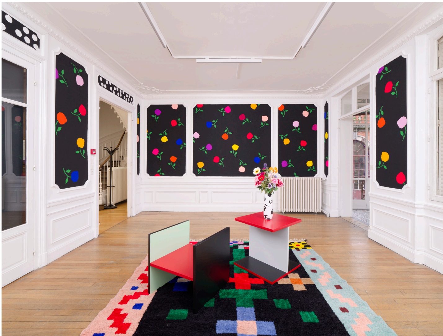
Vue d'exposition, Casa Karina , Karina Bisch, du 17 janvier au 18 avril 2026 Crédits photos: Aurélien Mole Courtesy de l'artiste Karina Bisch et ADAGP 2026